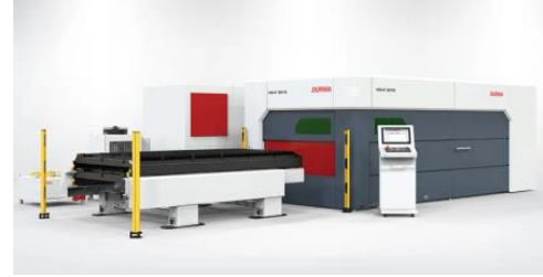
HD-F šķiedru lāzers