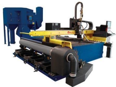
Kombinētā plazmas griešanas mašīna lokšņu metālam un caurulēm AJAN.

Noklikšķiniet uz attēla un sekojiet saitei, lai iegūtu pilnu informāciju Nordcity.lv