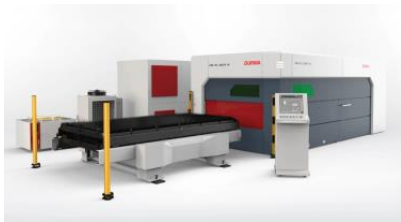
HD-FL šķiedru lāzers