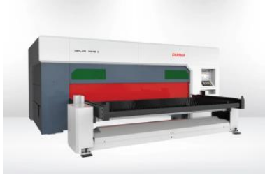
HD-FS rokas šķiedru lāzers