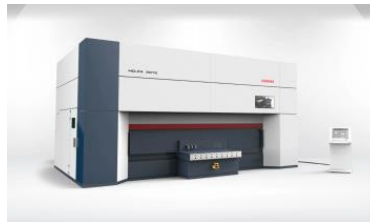
HD-FA 5 asu lāzers