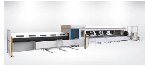
HD-TC lāzers cauruļu un profilu griešanai

Noklikšķiniet uz attēla un sekojiet saitei, lai iegūtu pilnu informāciju Nordcity.lv