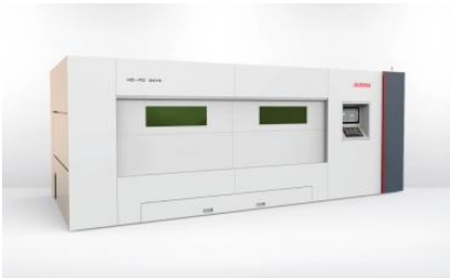
HD-FO šķiedru lāzers

Ar katru DURMA lāzergriešanas mašīnu (lokšņu vai cauruli) rezerves griešanas galva septembrī ir par brīvu.